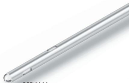
REF 2920 zylindrische Spitze cylindrical tip