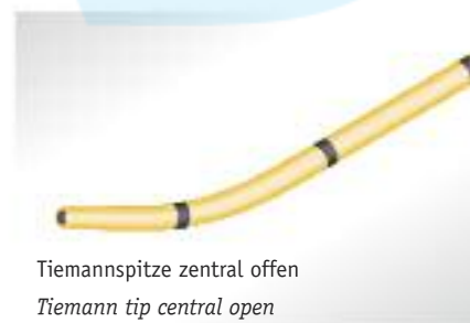
Tiemannspitze zentral offen Tiemann tip central open