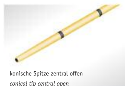
konische Spitze zentral offen conical tip central open